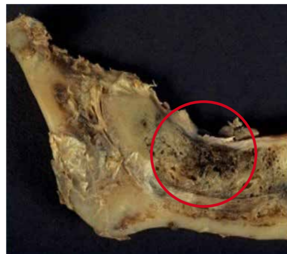
Abgestorbenes, totes Gewebe – NICO

Der Begriff NICO ist eine Abkürzung aus dem Englischen und beschreibt Hohlräume (Löcher) im Kieferknochen. Diese Hohlräume entstehen meistens, wenn Zähne (hier vor allem die Weisheitszähne!) gezogen werden und der Körper zu diesem Zeitpunkt nicht ausreichend mit Vitaminen und Mineralstoffen versorgt war. Diese Nährstoffe sind aber extrem wichtig für eine gesunde Heilung nach einer Zahnentfernung und ein Mangel daran führt zwangsläufig dazu, dass Hohlräume im Kiefer verbleiben. In Untersuchungen zeigte sich, dass sich diese Hohlräume im Laufe des Lebens mit Bakterien, Pilzen, Viren und Toxinen füllen können. Auch wurden bereits erhöhte Konzentrationen von Borrelien, Quecksilber und sogar Glyphosat in diesen Arealen gefunden. NICO's sind also mit Schadstoffen gefüllte Hohlräume, die lokal zwar nicht zu spüren sind, aber enorme Auswirkungen auf die Gesundheit und das Immunsystem haben können. Denn sie belasten über Ihre Streuwirkung im gut durchbluteten Kiefer den ganzen Körper.