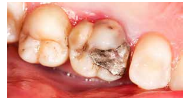
Ein kaputter Zahn – gefüllt mit Amalgam

Vor allem bei Amalgam ist die hochgiftige Wirkung vielfach nachgewiesen worden, denn Amalgam enthält bis zu 50% des toxischen Quecksilbers. Quecksilber ist eine der giftigsten Substanzen auf dieser Welt, ist extrem neurotoxisch (=Nervengewebe zerstörend) und wird stets als Sondermüll deklariert und behandelt. Trotz dieser Tatsachen wurde und wird es noch immer in die Zähne vieler Menschen eingebracht, ohne auf die zum Teil verheerenden Auswirkungen zu achten, welche sich dadurch zum Teil erst Jahre später für die Patienten einstellen. In vielen Ländern der Welt ist deshalb der Einsatz von Amalgam zum Teil schon seit mehreren Jahrzehnten gesetzlich verboten!